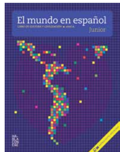
NIVEL A - Junior